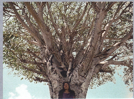
Fotos: | zvg | Shirin Neshat, Tooba | Beat Lüthi | Andreas Zimmermann | Remo Hexspeer | mauritius-images